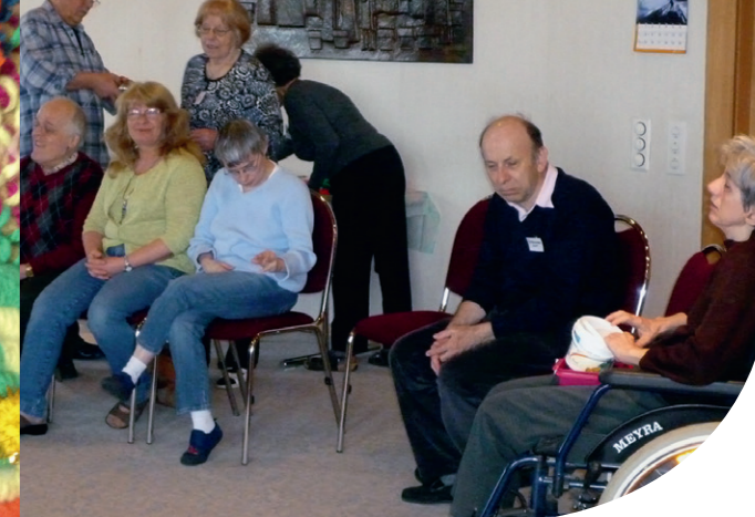
So farbenprächtige Bilder entstehen in den Kursen für höresehbehinderte Menschen.