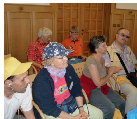
Ensemble, on est forts.