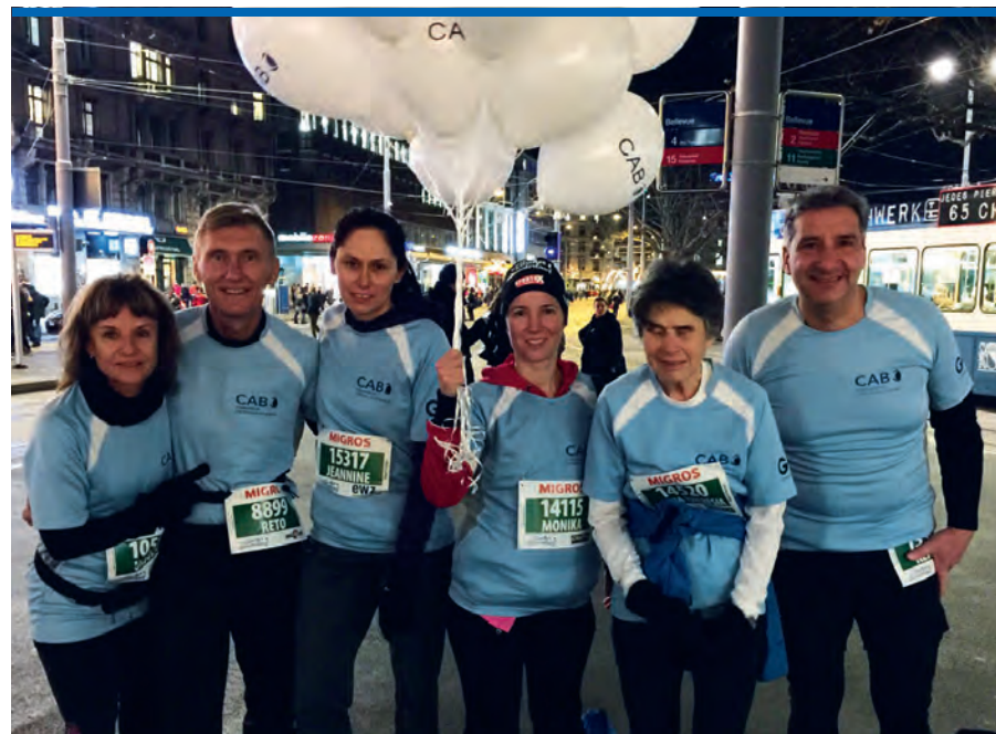
Les participants de la CAB à la course de la St-Sylvestre de Zurich 2015.